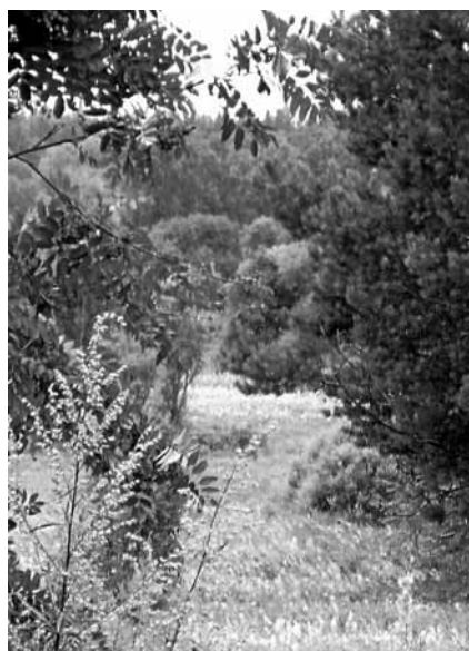
Jantselasta Marttilaan näkymä on metsittyynyt, pusikkoinen, ruohottunut.