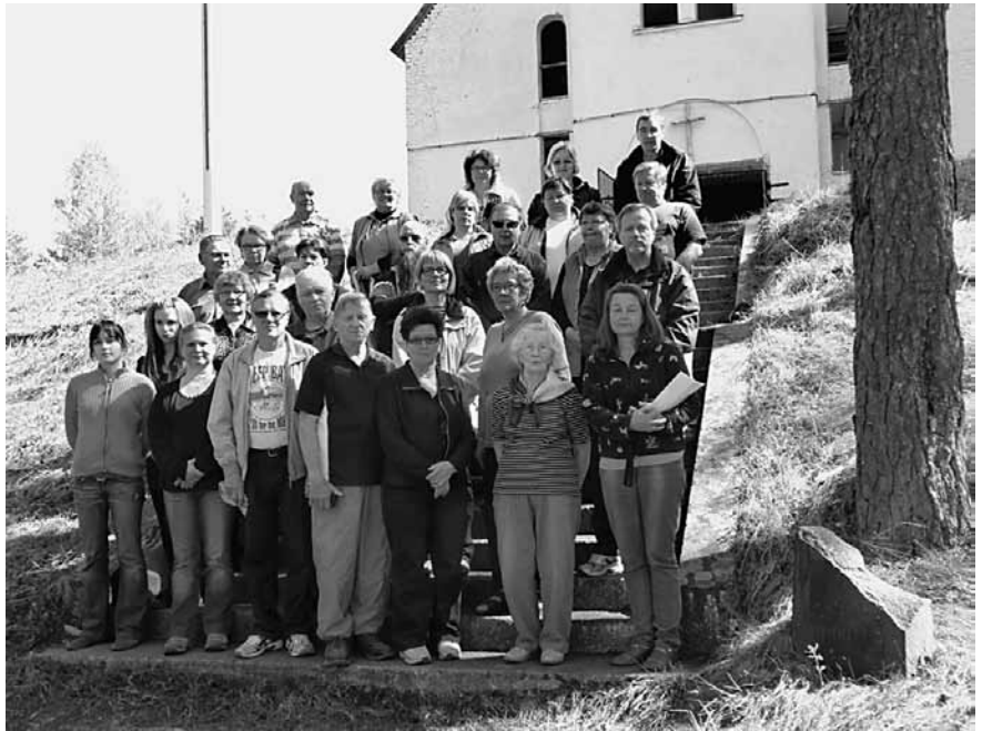
Talkoolaiset kirkon portailla.

Aikainen lähtö mahdollisti rajan ylityksen joutuisasti Vaalimaalla. Ensimmäisen päivän kohteemme oli Viipuri. Kaupunkiin tutustumisen lisäksi pysähdyimme pellavakaupassa ja kauppahallissa. Kaupunki pesee vähitellen kasvojaan. Saimme erinomaisen päivällisen illan päätteeksi uudessa Victoria-hotellissa kauppatorin äärellä. Majoittumaan emme kuitenkaan päässeet tähän uuteen hotelliin, vaan jouduimme tyytymään vanhaan Druzhbaan.